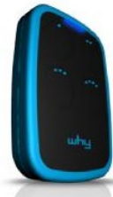
Bleu ref : telecopieuse_why2_blue Bord caoutchouc