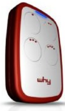
Rouge ref : telecopieuse_why2_red Bord caoutchouc