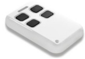
Blanche ref : telecopieuse_carty-r Bord arrondis, coque rigide

Livré avec la pile CR2032 et une ficelle nylon porte-clé