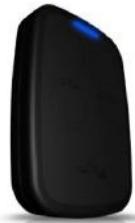
Noire ref : telecopieuse_why2_black Bord caoutchouc